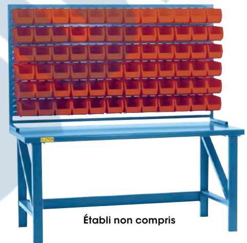
Établi non compris