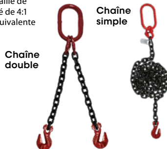
Crochet à chape à linguet