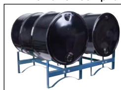
Barils non compris