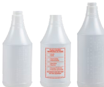
JN107 JN108 JN109