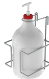
JN537 Cruche non comprise