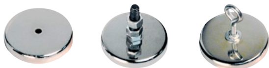
Aimants ronds plaqués Aimants ronds plaqués a/boulon Aimants ronds plaqués a/boucle

Les aimants ronds à profil bas sont idéals pour suspendre des enseignes, des lumières, etc. ou pour récupérer des objets des réservoirs, des cuves et des bacs.